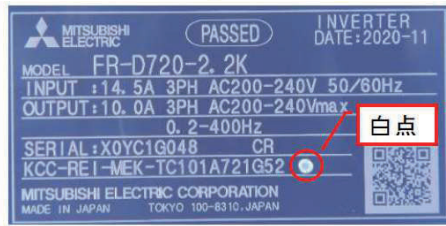
製品本体(容量3.7K以下)

なお、不具合対象の製造番号のうち、以下のように白点または黒点がある製品は対策済(部品交換済)です。