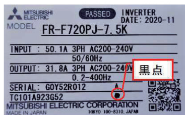
製品本体(容量5.5K以上)