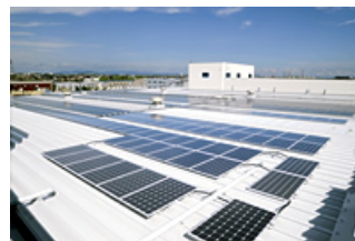
加古川東工場に設置された太陽光発電パネル

オークラグループは、環境保全に配慮した地球にやさしい企業活動を展開してまいります。