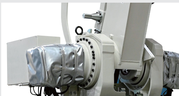
▲保温材でカバーしたモータ部をヒータで保温

モータをヒータで保温し、さらに保温材でカバー。 コールドスタート（長時間の休止からの始動）時でも 暖気運転なしの即稼働を実現しました。